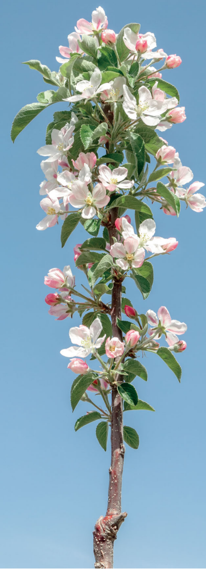
Ramo di melo in fiore in Val di Non. Nella pagina accanto: panorama da San Martino di Castrozza.

LE PROVAZIONI DI NESSERE DEL TERRITORIO SONO LA LINEA L'ANIMAZIONE E LO STAMPATO DELLA 200 ESEMPLARI